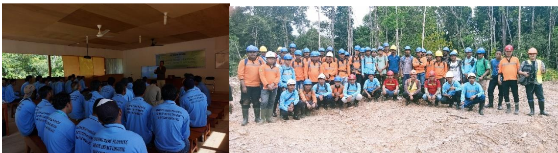
Gambar 13. Pelatihan Basic Planning Reduce Impact Logging