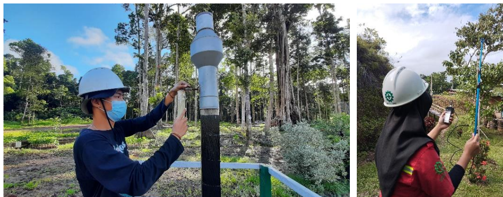
Gambar 6. Pengukuran curah hujan dan kecepatan angin

Pemantauan iklim mikro dilakukan pada lokasi yaitu di Persemaian dan Camp sikka KM 32. Pemilihan kedua lokasi dikarenakan lokasi tersebut representatif menggambarkan areal operasional perusahaan. Hasil rekapitulasi pemantauan iklim mikro selama tahun 2023 disajikan pada Tabel 8 .