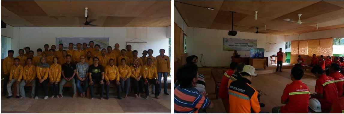
Gambar 11. Awarness National Fprest Stewardship Standart

Sampai dengan tahun 2022 PT. Kaltim Utama telah merealisasikan sebagian besar dari rencana pelatihan. Kegiatan pelatihan ini diharapkan dapat meningkatkan kapasitas sumber daya manusia. Kegiatan tersebut juga dapat mendukung pekerjaan supaya menjadi lebih efektif dan efisien.