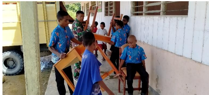
Gambar 9. Bantuan Fasilitas Pendidikan