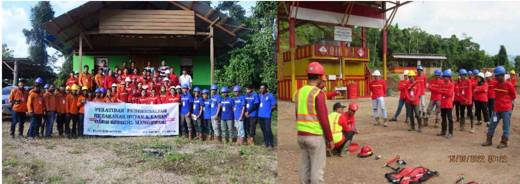
Gambar 11. Pelatihan Pengendalian Kebakaran Hutan dan Lahan Oleh BPPIKHL Manokwari