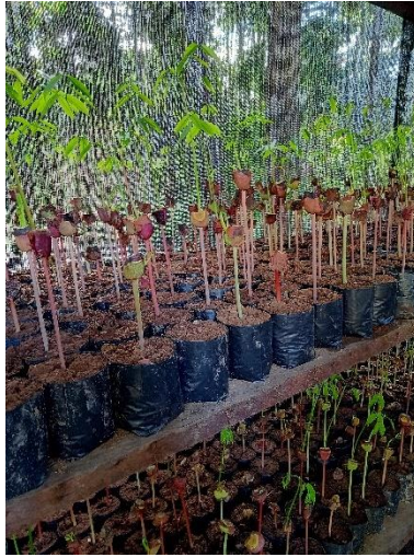
Gambar 2. Bibit Merbau di persemaian

Melimpahnya materi genetik dan keanekaragaman hayati serta tersedianya agen penyebar biji/benih di PT. Kaltim Utama mendorong kegiatan regenerasi ekosistem hutan secara alami terjadi lebih cepat. Fakta dilapangan di dapatkan bahwa jenis Merbau mampu meregenerasi melalui terubusan pasca penebangan, hal ini menjadi nilai positif tersendiri bagi jenis merbau termasuk juga PT. Kaltim Utama untuk menentukan strategi pengelolaan khususnya jenis merbau. Kondisi tersebut menggambarkan jika PT Kaltim Utama tidak menggunakan spesies asing dan/atau invasive dalam upaya meregenerasi hutan.