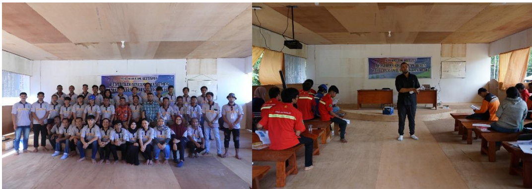
Gambar 12. Pelatihan Sistem Manajemen Keselamatan dan Kesehatan Kerja