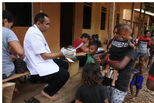
Gambar 10. Bantuan Kesehatan untuk masyarakat