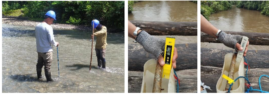
Gambar 5. Pengukuran Debit, pH, TDS

Hasil analisis menunjukkan bahwa adanya peningkatan dan penurunan jumlah debit air Sungai pada semester I dan semester II Tahun 2023. Debit air tertinggi dalam kurun waktu 1 (satu) tahun terjadi di outlet Sungai Wagani, sedangkan debit air terendah terjadi di outlet Sungai Iwaropu. Peningkatan dan penurunan debit air Sungai sendiri diduga bersamaan dengan intensitas curah hujan. Pemantauan fisik lainnya menunjukkan bahwa lokasi pengamatan air sungai tersebut tidak berbau dan warna pada semua lokasi pengamatan cenderung berwarna terang hingga sedang. Adanya warna sedang pada air sungai mengindikasikan bahwa terdapat bahan-bahan yang tersuspensi dan terlarut ke dalam air sungai sehingga menyebabkan air sungai menjadi tidak terang.