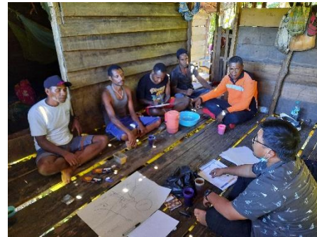
Gambar 8. Sosialisasi sebelum kegiatan operasional perusahaan

Kewajiban lain yang dilakukan perusahaan kepada masyarakat adalah pembayaran kompensasi hak ulayat. Pembayaran kompensasi ini disampaikan setiap periode 3 bulan atas kayu-kayu produksi dari setiap pemilik ulayat RKT berjalan. Kompensasi diserahkan secara tunai di depan umum atau di depan masyarakat adat yang disaksikan oleh Kepala Suku, Kepala Kampung, Kepala Distrik, dan atau pihak dari Kabupaten kepada pemilik hak ulayat.