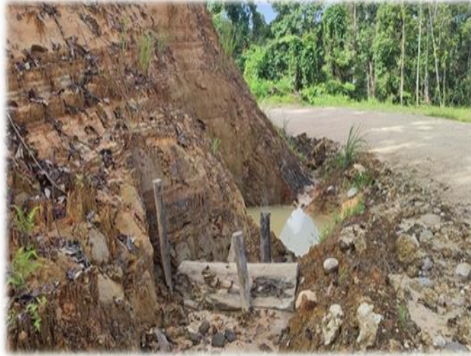
Gambar 3. Sediment Trap

PT. Kaltim Utama merupakan perusahaan yang mendapatkan ijin untuk pemanfaatan hasil hutan kayu. Terkait hasil hutan bukan kayu, PT. Kaltim Utama hanya melakukan inventarisasi serta identifikasi hasil hutan bukan kayu yang dilakukan pada saat kegiatan Inventarisasi Tegakan Sebelum Penebangan (ITSP). Kegiatan ITSP juga menjadi landasan penting dalam penguasaan lahan untuk kegiatan selanjutnya seperti penentuan pola sarad/trase jalan, pembuatan batas partisipatif dan pengelolaan NKT serta pembuatan jalan sarad kayu yang ramah lingkungan.