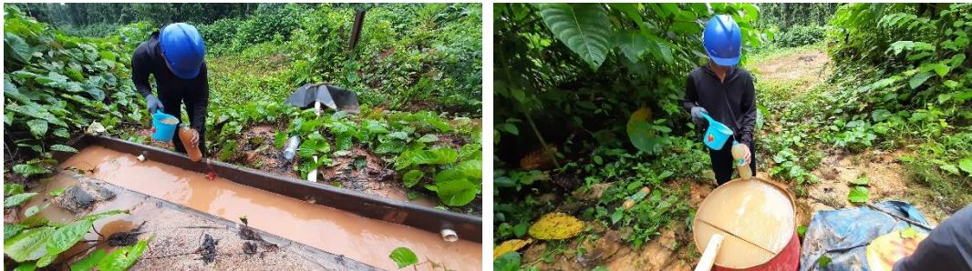
Gambar 4. Pengambilan sampel air pada bak erosi

Pemantauan laju erosi dilakukan pada areal bekas tebangan yaitu Blok RKT 2020 dan Blok RKT 2021. Metode yang digunakan adalah dengan menggunakan metode Bak Erosi. Berdasarkan Kriteria Tingkat Bahaya Erosi dari Dirjen RRL Dephut (1998) hasil analisis Erosi pada Blok RKT 2020 dan 2021 berada pada tingkat sangat ringan hingga sedang.