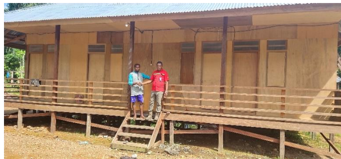
Gambar 10. Bantuan Rumah untuk warga