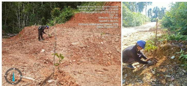
Gambar 1. Kegiatan Penanaman