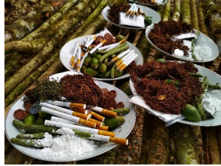
Gambar 7. Ritual Sinara oleh Masyarakat Adat sebagai tanda perijinan operasional RKT dari Masyarakat Adat

Proses Sinara merupakan proses lanjutan terkait dengan sosialisasi mengenai operasional RKT di tahun kedepan setelah terjadi kesepakatan antara pihak perusahaan dan masyarakat pemilik ulayat mengenai hak dan kewajiban kedua belah pihak dengan tanpa paksaan. Sosialisasi RKT juga sebagai media perusahaan untuk mendapatkan informasi mengetahui lokasi – lokasi dimana terdapat hak-hak masyarakat pemilik ulayat seperti situs budaya, kuburan, rumpun sagu ataupun lokasi yang dikeramatkan.